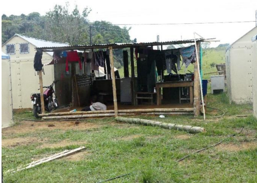
Figura 5 Módulos de vivienda